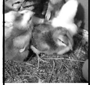
цыплят от кур-несушек . Т. 8-952-725-70-65;

козлика Альпийская (1мес., с родословной). Т. 8-950-636-61-61;