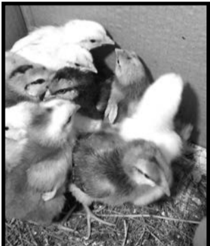
цыплят от кур-несушек . Т. 8-952-725-70-65;

баранов . Т. 8-982-768-55-05; бройлеров , гусят, утят, цыплят, кур-несушек, возм. на мясо. Адрес: ул. Цветочная, 9. Т. 8-952-725-70-65; гусят (1мес., 8шт.) - 500 р./шт., утят мускусные (1мес., 8шт.) - 400 р./шт. Т. 8-952-148-90-45; жеребца Владимирский тяжеловоз (5 лет, заезжен под верх, отличный производитель, дает хороших жеребят, держит косяк). Ц. 300 т.р. Т. 8-982-746-92-33; коз Зааненская (чистопородные). Т. 8-982-746-92-33; козочек и козчиков (бмес.). Ц. 3,5 т.р. Т. 8-909-010-18-59; козу Альпийская (дойная), козла Альпийская. Т. 8-950-636-61-61; коней Владимирская-Орловская (1 год). Т. 8-982-746-92-33;